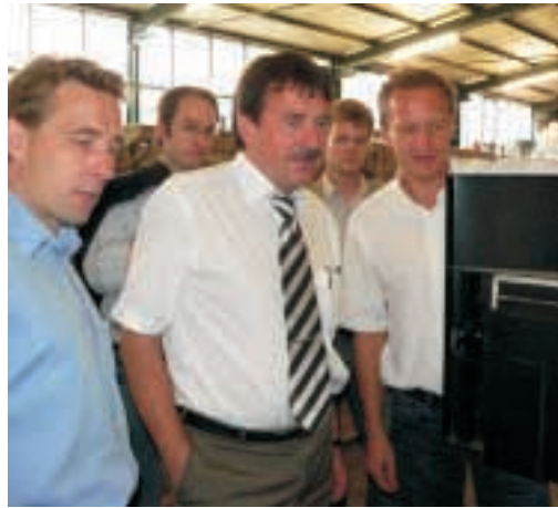
AS Solar, Hannover