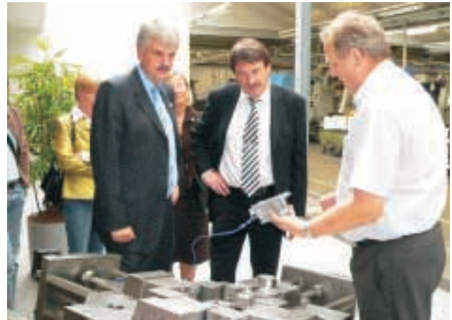
Technologie Centrum Northwest (TCN), Schortens