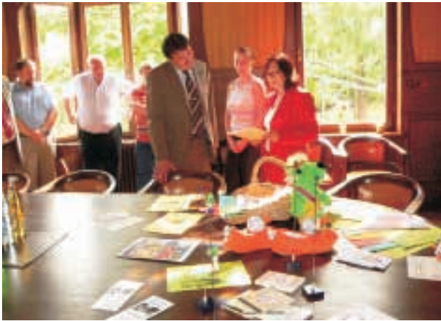
Rathaus Bad Sachsa