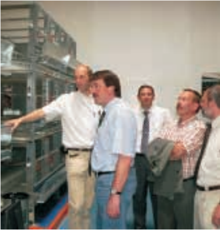
Big Dutchman, Calveslage