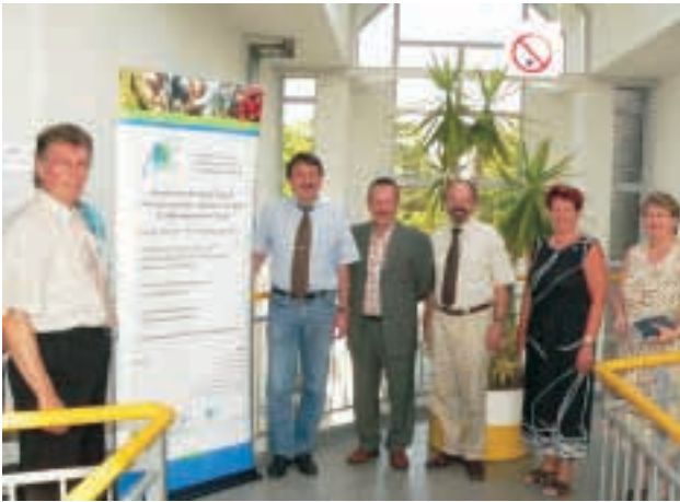
ISPA/NieKE, Hochschule Vechta