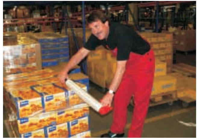
Betriebspraktikum bei Bahlsen, Hannover