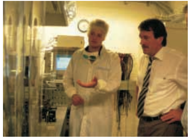
Laser Zentrum Hannover