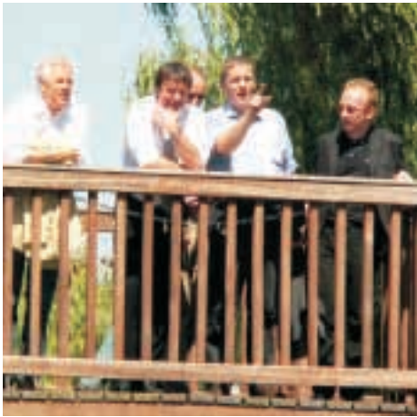
Besichtigung von Hitzacker