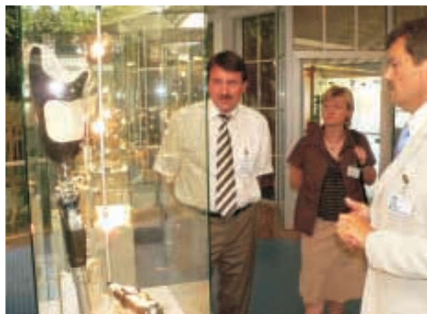
Otto Bock, Duderstadt