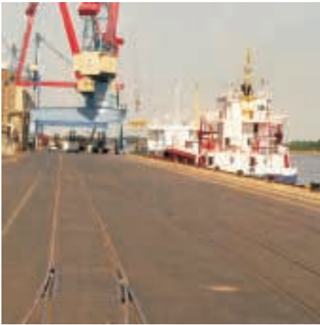
Hafenanlage in Brake