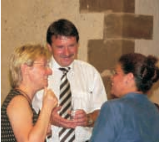
Im Gespräch nach dem Vortrag