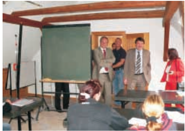
Jugend- und Bildungshaus Tettenborn