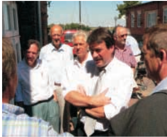
Im Gespräch mit Hochwassergeschädigten