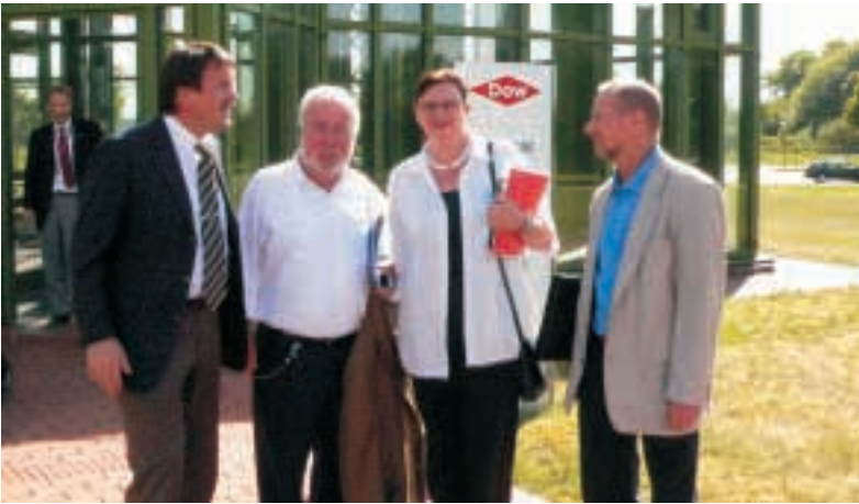
Dow Chemicals, Stade