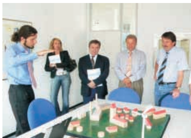
Forscher erklärt Software zur Energiesteuerung