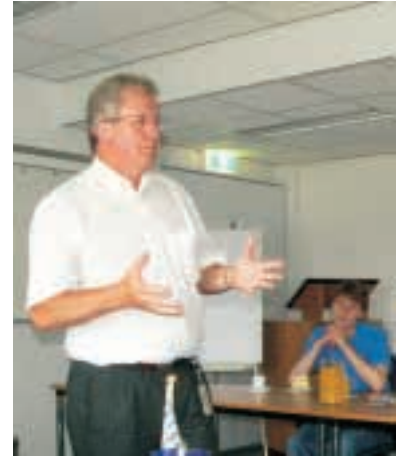
Penske Logistics, Coevorden