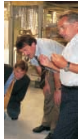
Stöbich Brandschutz, Goslar

Hameln-Pyrmont (HW). Seit zehn Jahren gehört die “Sommerreise” zum festen Programm (...). “Das hat nichts mit Urlaub zu tun, sondern soll dazu dienen, das Land besser kennen zu lernen und bestehende Kontakte zu erhalten”, sagt der 1948 im Schaumburgischen Lüdersfeld geborene Landespolitiker, der gestern in der Rattenfängerstadt Station machte. In Absprache mit den heimischen Landtagsabgeordneten der SPD besucht der ehemalige Landesumweltminister Unternehmen, Institutionen und Einrichtungen, um vor Ort persönliche Eindrücke zu gewinnen. “In diesem Jahr schwerpunktmäßig Betriebe, die sich mit Forschung und neuer Technologie beschäftigen”, wie Jüttner erklärte.