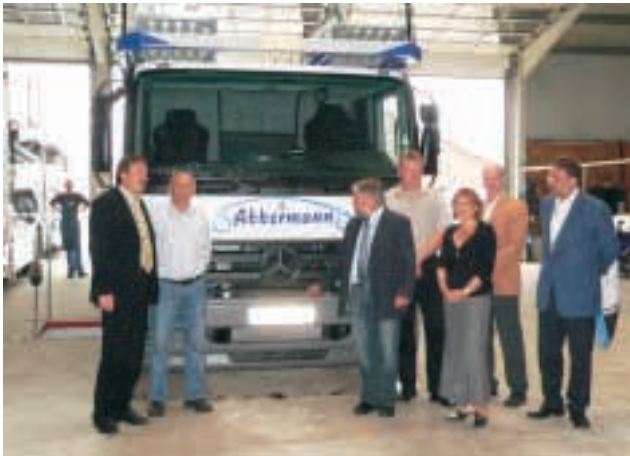
Zu Besuch in Ostfriesland