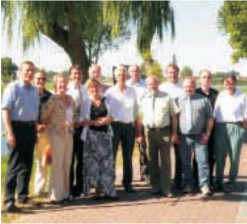
Am Elbufer, Hitzacker