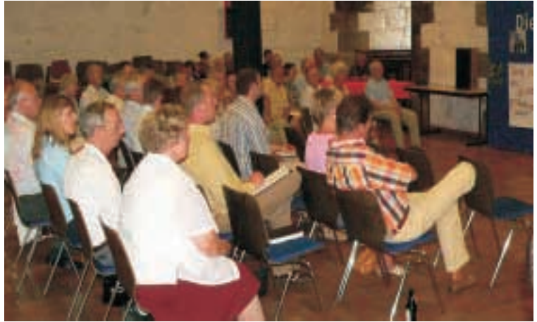
Interessiertes Publikum in Hardegsen

Hardegsen(f). Etwa 50 SPD-Mitglieder und Gäste versammelten sich im großen Saal der Burg Hardeg anlässlich des Vortrags des SPD-Landtagsfraktionsvorsitzenden Wolfgang Jüttner: "Stellenwert der frühkindlichen Bildung vor dem Hintergrund der sozialen Gerechtigkeit" war das Thema. Einleitende Worte sprachen die neue Stadtverbandsvorsitzende Eva-Susanne Jannsen und Frauke Heiligenstadt, die im Landtag Sprecherin der Enquetekommission demographischer Wandel ist. (...)