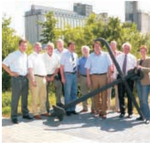
Niedersachsen Ports, Brake