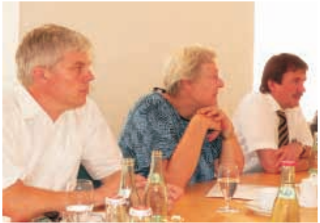
Zu Gast am Hochschulstandort Lingen