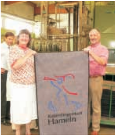
MEWA Textil-Mietservice, Hameln