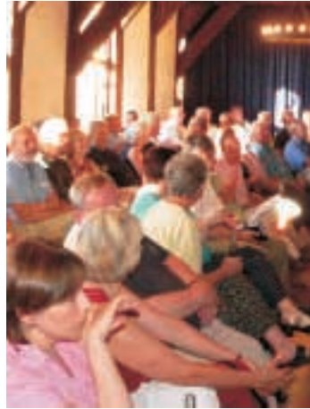
Diskussionsveranstaltung im Elbschloss Bleckede