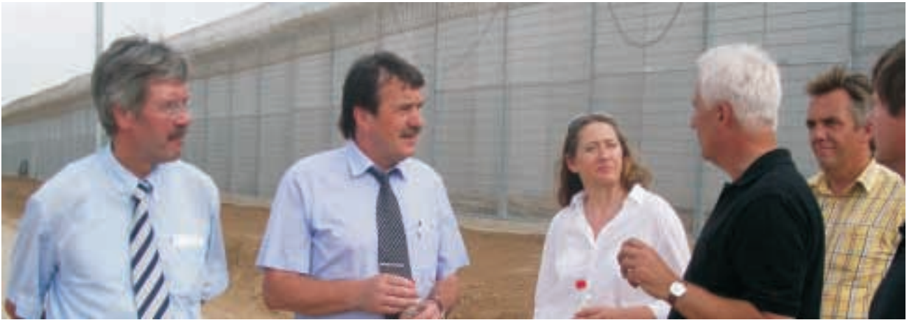
Neubau der Justizvollzugsanstalt Rosdorf