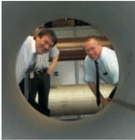
Firma Butting, Knesebeck