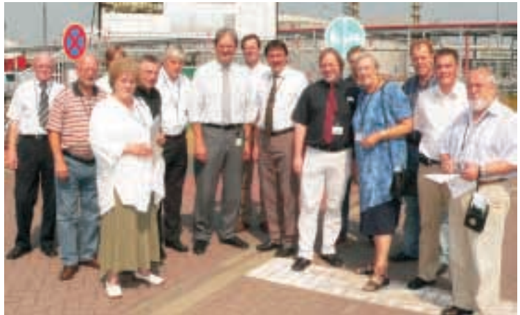
Besichtigungsgruppe vor der BP-Erdölraffinerie Lingen

Von dem Umsatz von 2,1 Milliarden Euro fließen allein aus Lingen 1,3 Milliarden Euro Mineralölsteuer in die öffentlichen Kassen. Durch Investitionen und Lohn der Beschäftigten ergibt sich ein erheblicher Kaufkrafteffekt für die Region. Auch auf Ausbildung wird großer Wert gelegt. Die im Betrieb ausgebildeten Jugendlichen haben gute Chancen auf Weiterbeschäftigung, obwohl das Unternehmen über seinem Bedarf ausbildet.